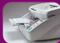
Nejvyšší poloha (100 listů)

Podavač dokumentů nabízí na výběr hned tři režimy (100, 300 a 500 listů), které můžete libovolně využívat podle objemu skenované dávky. Tím zvýšíte efektivitu a současně ušetříte čas.