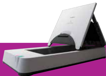
Jednotka plochého skeneru 101 formátu A4

Skenujte knihy, časopisy nebo křehká média s pomocí jednotky plochého skeneru 101 pro dokumenty do formátu A4 nebo jednotky plochého skeneru 201 pro dokumenty až formátu A3. Tyto volitelné ploché skenery se ke skenerům DR-G1130 a DR-G1100 připojují přes rozhraní USB a perfektně s nimi spolupracují. Můžete tak skenovat dvojnásobný počet dokumentů a využít přitom stejné funkce vylepšení obrazu při každém skenování.