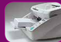
Nejnižší poloha (500 listů)