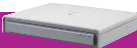
Jednotka plochého skeneru 201 formátu A3