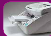
Střední poloha (300 listů)