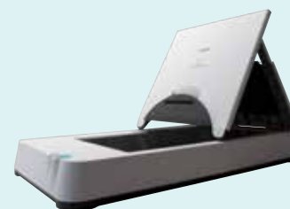
Jednotka plochého skeneru 101 formátu A4

DR-C225/W je vybaven celou řadou intuitivních funkcí, které pomáhají zjednodušit proces skenování. Plně automatický režim (při použití softwaru CaptureOnTouch) použije nejlepší nastavení klíčových parametrů dokumentu – včetně orientace textu, detekce velikosti stránky, barev, rozlišení a přeskočení prázdné stránky. Tím vám ušetří čas i námahu.