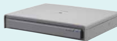
Jednotka plochého skeneru 201 formátu A3